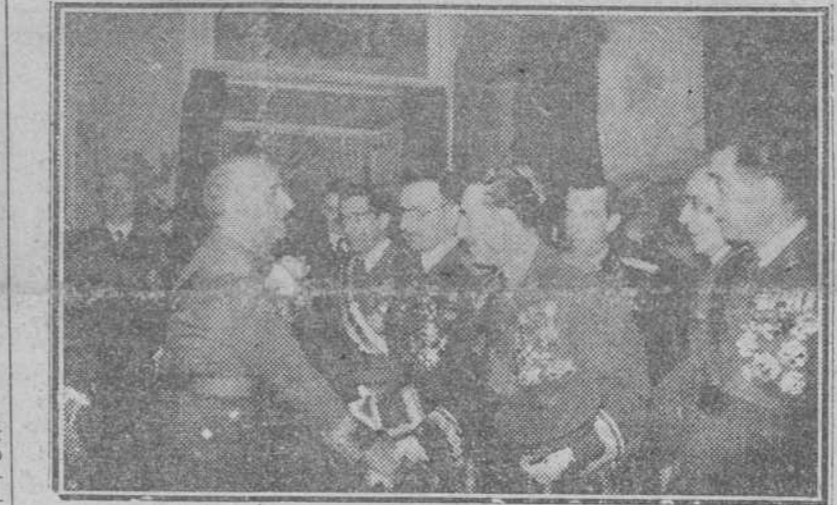
Madrid.—Su Excelencia el Jefe del Estado, recibió en el Palacio de El Pardo a los más altos jefes de las Fuerzas Armadas, con motivo de la Pascua Militar.