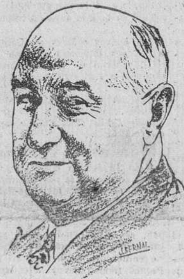
MR. JAMES FARLEY