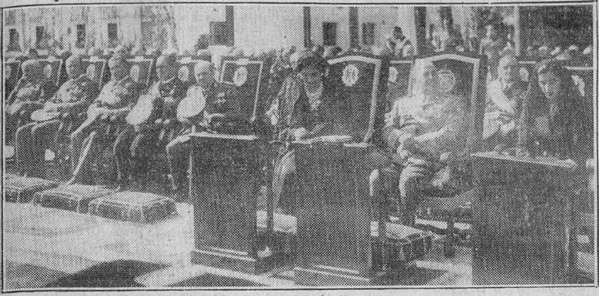
EL PARDO, Su Excelencia el Jefe del Estado, acompañado de su esposa e hija y miembros del Gobierno, asiste a la tradicional misa de campaña celebrada con motivo de su fiesta onomástica.