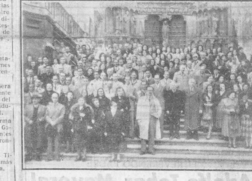
Los maestros concurrentes a la Asamblea fotografiados a la salida de la Catedral, después de asistir a la Misa del Espíritu Santo, como acto primero de sus tareas.

Más de 400 maestros burgaleses asisten a las reuniones