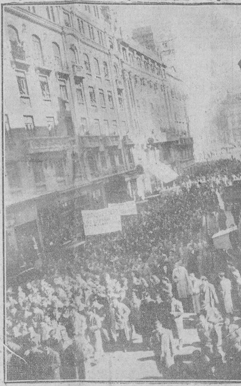
Madrid.— Una vista de la manifestación que salió de la Universidad Central como protesta contra el proceso del Cardenal Mindszenty y en la que se calcula tomaron parte unos 40.000 estudiantes madrileños.