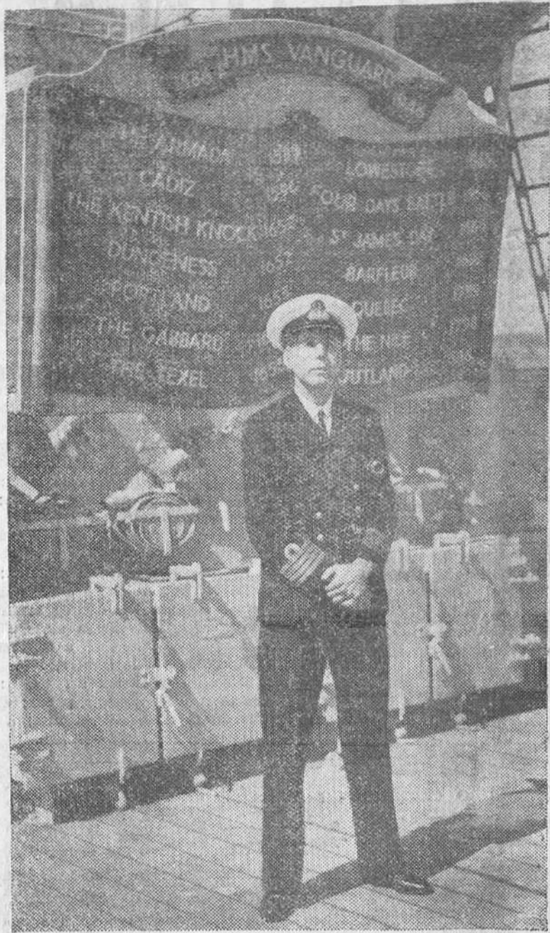
El comandante del nuevo acorazado británico "Vanguard", que ha sido botado recientemente, posa delante de una lápida conmemorativa que recuerda los héroes caídos en batalla a los buques que ostentaron anteriormente el mismo nombre.