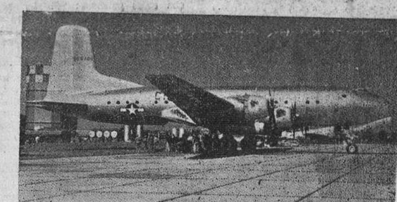
Aeródromo de Mitchell (Nueva York).— He aquí el C-74 Douglas Globemaster, el mayor avión del mundo para el transporte de tropas o mercancías. Tiene un peso bruto de 72 toneladas, está propulsado por cuatro motores de 3.000 caballos cada uno y lleva 11.160 galones de gasolina. Puede transportar 125 soldados armados o bien un cargamento de 20 toneladas.