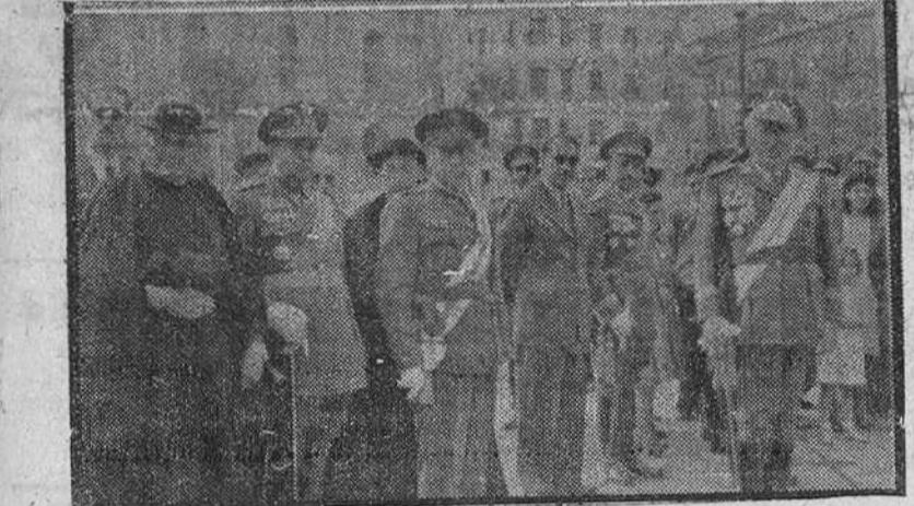
El capitán general, acompañado por todas las demás autoridades, presencia el desfile de las tropas de Intendencia, en la plaza del Doctor Albiñana.