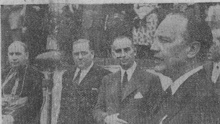
Barcelona.— El ministro de Justicia, don Raimundo Fernández Cuesta, durante su discurso en el Grupo Benéfico del Tribunal de Menores.