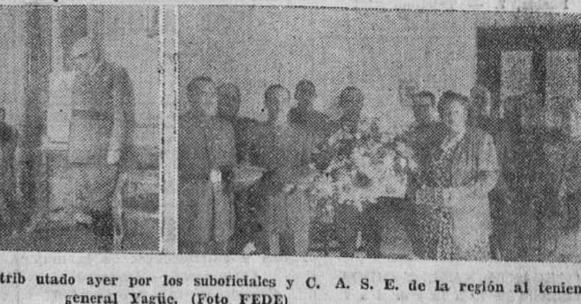
Dos momentos del homenaje tributado ayer por los suboficiales y C. A. S. E. de la región al teniente general Yagüe.

Protesta de nuestro Rvdmo. Prelado por la condena dictada contra Monseñor Stepiac