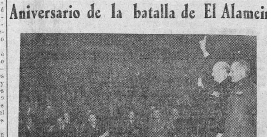
Londres.—Mr. Churchill, acompañado del mariscal "Mont", hace el signo de su famosa V, durante el acto celebrado el pasado día 25 en Albert Hall, con motivo de la celebración de la batalla de El Alamein.

Teherán.—En los círculos bien informados de esta capital se anuncia que las fuerzas del Gobierno central han iniciado una ofensiva en el sector de Sadaah, en la que intervienen tanques y piezas de artillería pesada. Se añade que los dirigentes demócratas kurdos han enviado un cable al primer ministro Ghavam es Sultaneh, en el que le preguntan si su Gobierno quiere la guerra.—Efe.