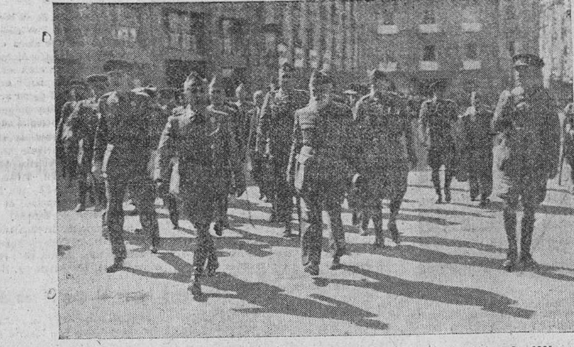
UNA FOTO HISTORICA... El Caudillo, a su llegada a Burgos el día 1.º de Octubre de 1936, pasa revista a las tropas que le rindieron honores en la Plaza de Alonso Martínez. Le acompañan el presidente de la Junta de Defensa Nacional, general Cabanellas y el glorioso general, D. Emilio Mola Vidal.

La bandera roja y gualda y las de las Milicias nacionales, cuajaban de vistosos colores las fachadas de los edificios de Burgos y en las calles, el público transitaba con dirección a la plaza de Alonso Martínez. La no muy extensa amplitud de la misma, obligó pronto a la muchedumbre a situarse en los comienzos de la calle de Lain Calvo y otras adyacentes. El clamor de aquella enorme masa humana, era incesante y se entonaban sin descanso himnos y vítores a Cristo Rey, a España, a Franco y a Mola, con un fervor y un patriotismo difíciles de superar.