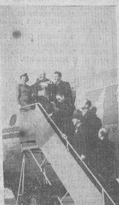
Le condujo directamente de Roma al aeropuerto de Barajas, es saludado por diversas personalidades españolas, entre los aplausos del público, que le tributó una cariñosísima acogida.