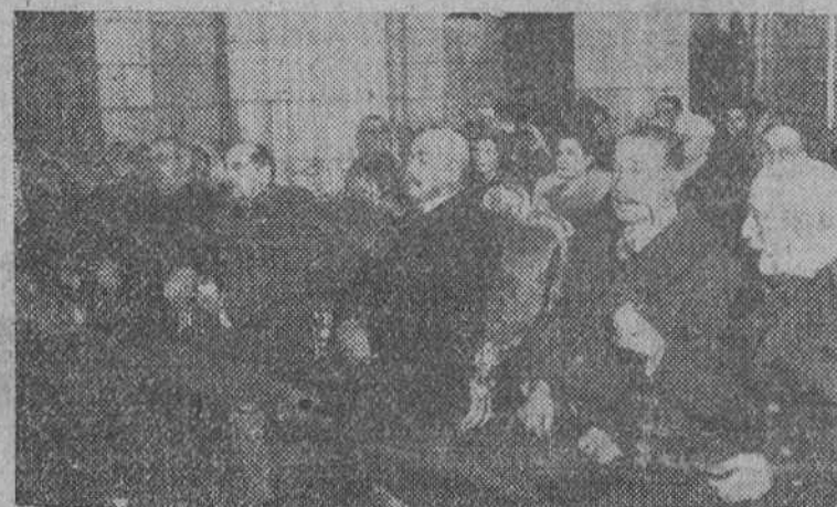
La promoción de Infantería a la que pertenece el ministro del Ejército, teniente general Dávila, ha celebrado una función religiosa en memoria de los fallecidos del Cuerpo pertenecientes a la misma