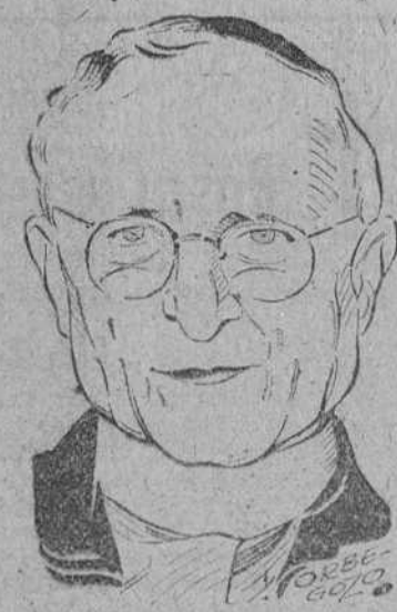
Monseñor Arteaga y Belancourt, Cardenal arzobispo de La Habana que no ha podido concurrir a la ceremonia final del Consistorio, por encontrarse enfermo

Roma.-Monseñor Guevara, cardenal del Perú, padece un ataque gripal, y durante la pasada noche ha sufrido un aumento de temperatura. Los médicos han manifestado que no hay mo-