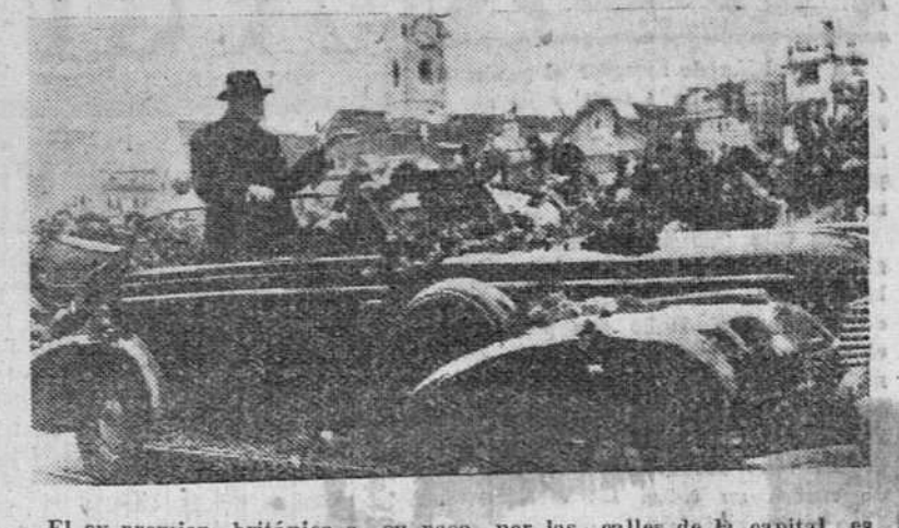
El ex-premier británico a su paso por las calles de la capital es aclamado por el pueblo que le dispensó una acogida entusiasta