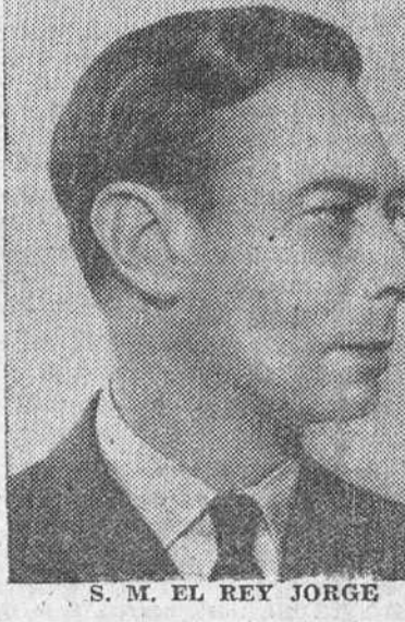
S. M. EL REY JORGE

El rey Jorge añadió que hay necesidad de vigorizar la industria británica y el comercio de ultramar, de