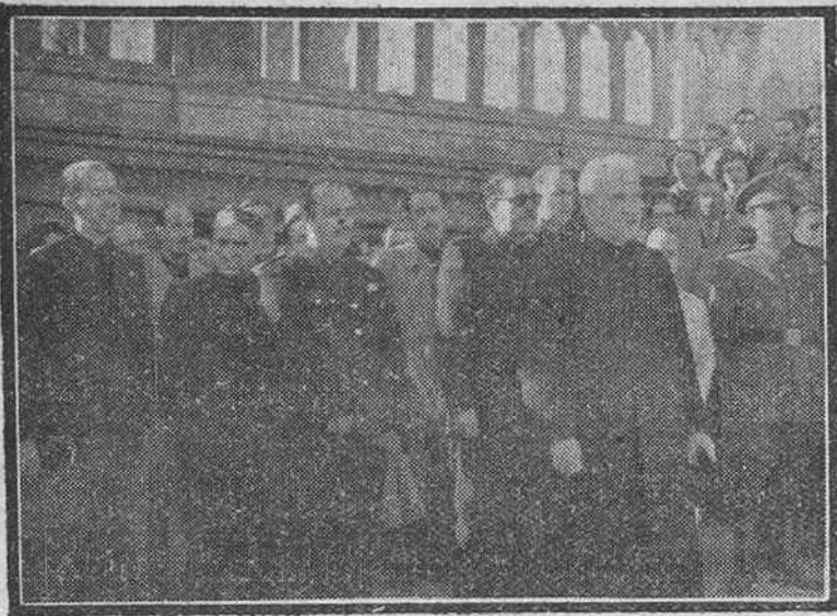
Autoridades y jerarquías escuchando las palabras del asesor religioso del Frente de Juventudes, en la ofrenda de coronas en homenaje a José Antonio.

El XI aniversario de la muerte de José Antonio, conmemorado en Burgos