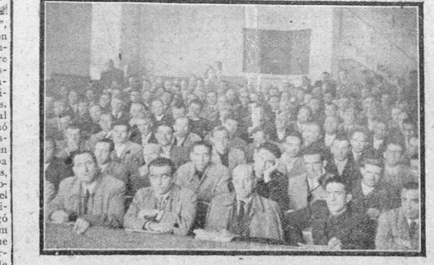
Los miembros de la Hermandad provincial de Labradores y Ganaderos, durante la sesión inaugural de la Asamblea.

Paris.— León Blum ha terminado su consulta con los dirigentes del partido socialista y ha marchado al palacio presidencial a las siete de la tarde, para informar al presidente Vincent Auriol.—Efe.