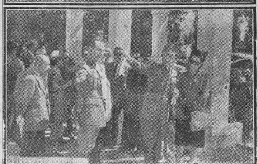
Los congresistas de la reunión internacional de seguros fotografiados ayer a la salida del Ayuntamiento y durante la visita que realizaron a las instalaciones del "Dos de Mayo"

A las tres de la tarde de ayer, y ocupando diversos coches y dos autocares de la Dirección General de Turismo, llegaron a nuestra ciudad los congresistas extranjeros y técnicos de Seguros de la "reunión internacional de técnicos aseguradores" que se celebrará a partir de hoy en la ciudad hermana de Santander.