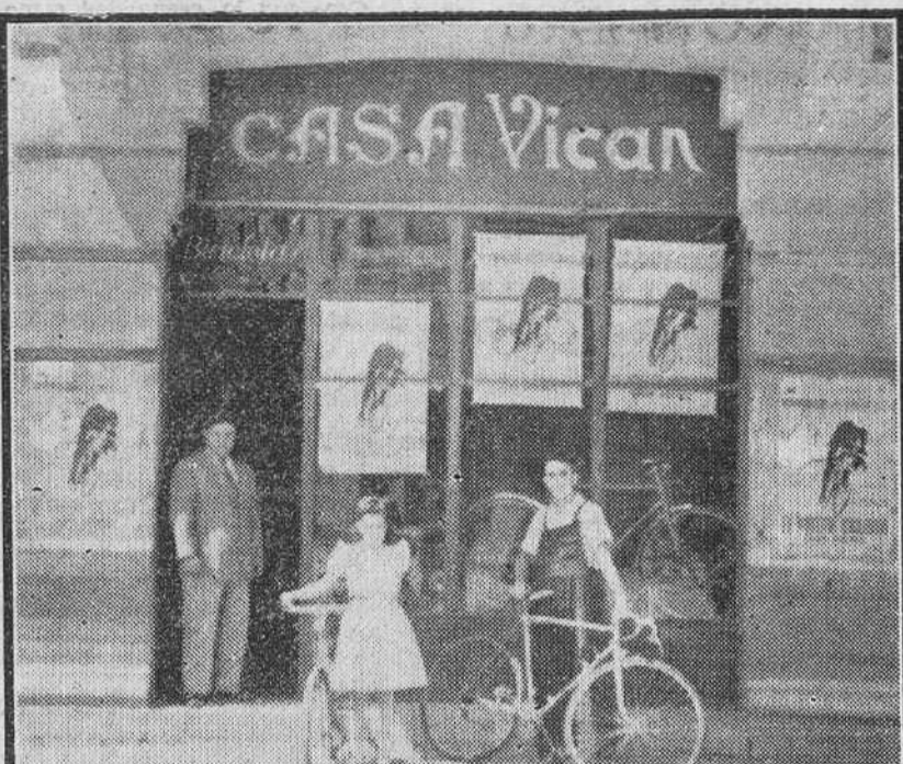
La Casa Vicán, emporio del ciclismo burgalés, abre un paréntesis en sus actividades comerciales. De nuevo en la palestra deportiva, su Gran Premio ha movilizó a los gigantes de la ruta española. Singular acontecimiento que le permitió contar con un nuevo triunfo en su historia comercial y deportiva.