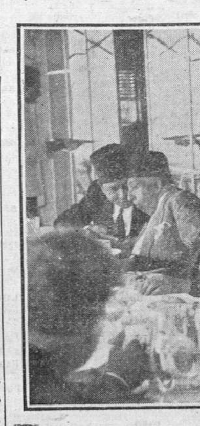
Madrid. — El primer ministro del Gobierno egipcio, Nokrasy Baja ha permanecido unos minutos en el aeropuerto de Barajas, donde comió con su séquito, antes de continuar su viaje a Nueva York, donde presentará la reclamación de Egipto contra a Gran Bretaña ante el Consejo de Seguridad de la O. N. U.