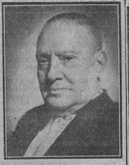
DON MANUEL MACHADO

Madrid. — El descenso de la temperatura se debe a una ola de frío, que pasará, por ser una cosa accidental, según ha declarado el director del Observatorio de Madrid. Los calores volverán, aunque no con la intensidad de los días pasados.