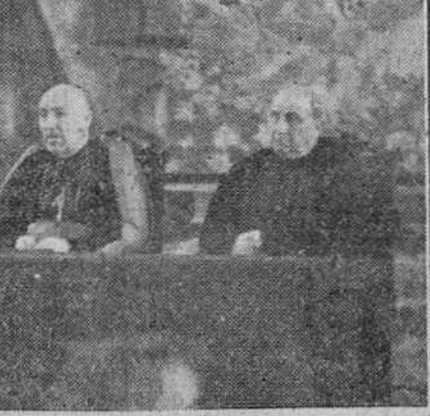
Presidencia de la solemne sesión de clausura del Cursillo de Misionología celebrado en nuestra ciudad durante los últimos días.