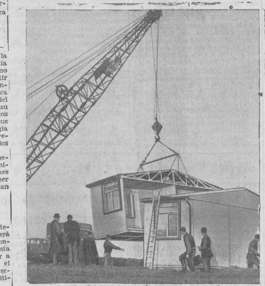
Todas las fábricas británicas que construyeron durante la guerra aviones, están dedicadas actualmente a la fabricación en serie de casas de aluminio, cuyo coste aproximado es de unas mil libras esterlinas. Estas casas se instalan luego con gran rapidez, como nos muestra la fotografía.