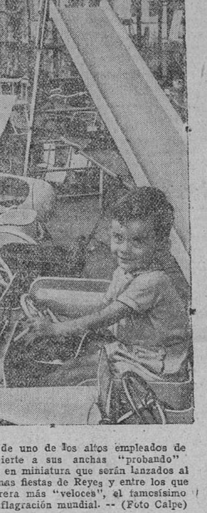
Este pequeño automovilista, hijo de uno de los altos empleados de una fábrica de juguetes, se divierte a sus anchas "proban-do" los diversos modelos de vehículos en miniatura que serán lanzados al mercado con motivo de las próximas fiestas de Reyes, y entre los que figura, junto a los coches de carrera más "veloces", el famosísimo "jeep", creación de la última conflagración mundial.

Washington.—El secretario de Estado norteamericano, general Marshall, dirigió anoche por Radio al pueblo norteamericano, un discurso en el que explicó las causas determinantes del fracaso de la conferencia de Londres. Marshall comenzó diciendo que el resultado de la reciente reunión del Consejo de ministros de Relaciones Exteriores fue desalentador. Manifestó que él ya preveía una gran dificultad para llegar a un amplio acuerdo, pero que, sin embargo, acentuaba la esperanza de que pudieran ser adoptadas tres o cuatro decisiones fundamentales que permitieran aliviar la grave situación actual de Alemania.