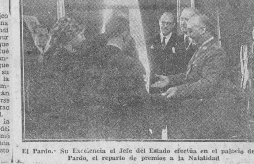
El Partido.—Su Excelencia el Jefe del Estado efectúa en el palacio de El Partido, el reparto de premios a la Natalidad