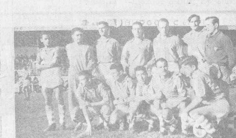
LOS EQUIPOS PALENCIA Y JUVENTUD QUE EL PASADO DOMINGO EMPATARON A CERO EN ZATORRE.

teros de baja calidad y hasta cierto aburrimiento que no llegó a manifestarse en toda su dimensión por el índice del resultado. Y así hasta el minuto final en que una internada de Rufino, justamente en el último minuto, pudo dar el partido resuelto al Juventud; pero el exterior quiso asegurar el tanto y, al retener la pelota, permitió el cruce del defensa derecho y el central, que le arrebataron el balón. Y es que en tales circunstancias —vamos a repetir de nuevo— no puede concederse esa ventaja que se mide por decenas de segundos. Lo único práctico es tirar, como sea. En esa jugada se esfumó la última y definitiva posibilidad que al Juventud le quedaba.