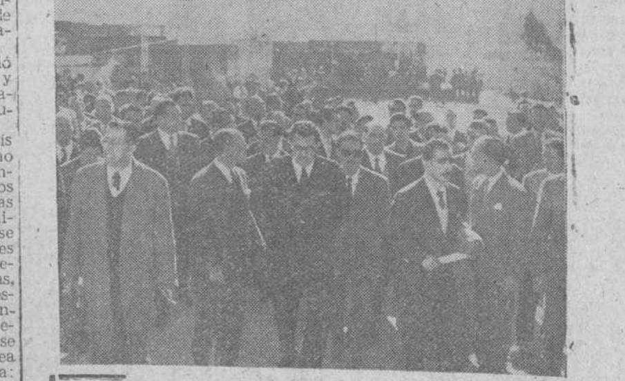
Madrid.—El subsecretario de Información y Turismo, señor Villar Palasi; el alcalde de Madrid y otras personalidades, durante el acto inaugural de la I Exposición de la Industria Nacional, que se celebra en la explanada de la Facultad de Filosofía y Letras de la Ciudad Universitaria.