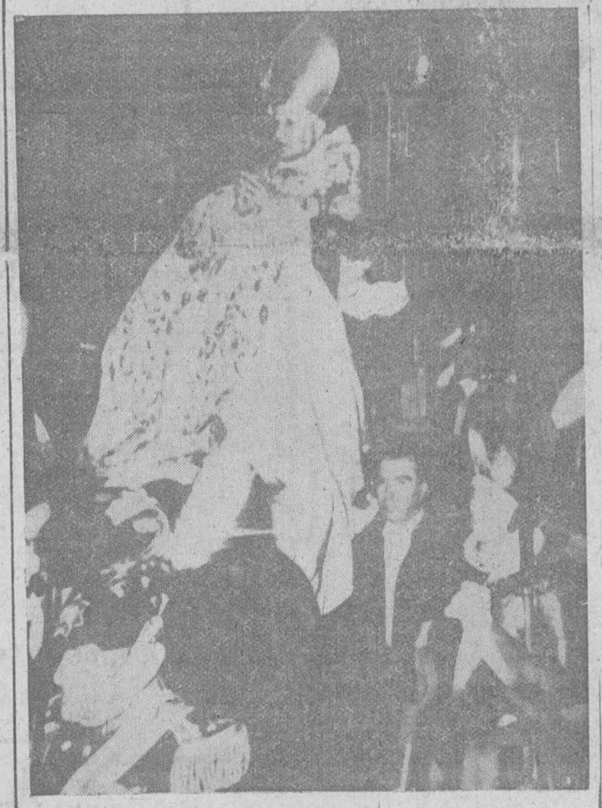
Ciudad del Vaticano.— Dos momentos de la solemne ceremonia de Coronación de Su Santidad el Papa, Juan XXIII. En la parte superior, el Santo Padre bendice a la muchedumbre y en el grabado inferior, aparece cuando es llevado en la Silla Gestatoria, por la Basílica de San Pedro.— (Telefotos CIFRA)