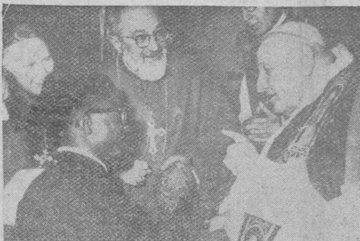
Ciudad del Vaticano. — S. S. Juan XXIII conversa con un estudiante de color del Colegio de Propaganda Fide de Roma, después de haber celebrado la Santa Misa. S. S. es director nacional del Instituto para la Propaganda de la Fe Católica. En el centro, el Cardenal Agagianian.