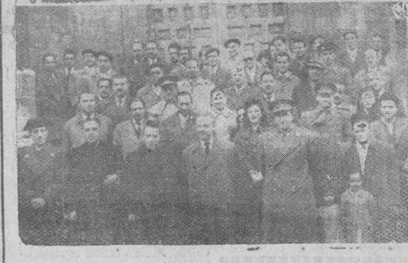
Grupo de navarros residentes en nuestra ciudad e invitados que asistieron ayer a la misa celebrada en la Santa Iglesia Catedral con motivo de la fiesta de San Francisco Javier, que celebró el “Solar Navarro”.