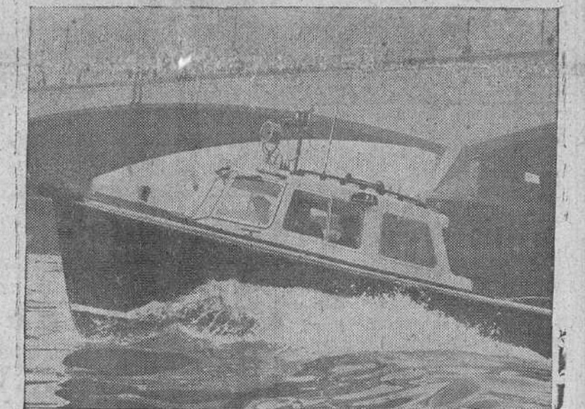
Esta embarcación de fibras de cristal, que mide 9 metros de eslora es el último tipo de lancha puesto en servicio recientemente por la sección del río Támesis, de la Policía Metropolitana de Londres. La lancha, cuyo casco está moldeado en dos secciones y remachado a una quilla de aleación de aluminio, pesa tres toneladas y media, unos 300 kilos menos que el tipo ordinario usado por la policía. Desarrolla una velocidad de más de 12 nudos a 2.000 revoluciones.

Nueva lancha de fibra de cristal para la Policía Fluvial de Londres