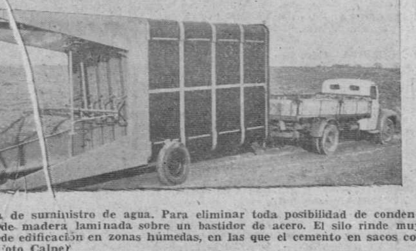
Esta máquina constituye el primer silo completamente móvil hasta ahora construido para almacenamiento de cemento. Fabricada en Gran Bretaña, sirve para conservar cemento seco en condiciones de perfecto uso por tiempo indefinido. También hace posible el preparar cemento de cualquier consistencia que se desee, donde quiera que se disponga de suministro de agua. Para eliminar toda posibilidad de condensación, el armazón está construido de madera laminada sobre un bastidor de acero. El silo rinde muy especial utilidad instalado en solares de edificación en zonas húmedas, en las que el cemento en sacos corre riesgo de rápido deterioro.