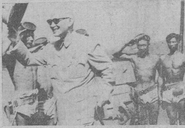
Taipeh (Formosa).—En una posición costera, el mariscal Chiang-Kai-Shek, pasa revista a un grupo de hombres-rana.