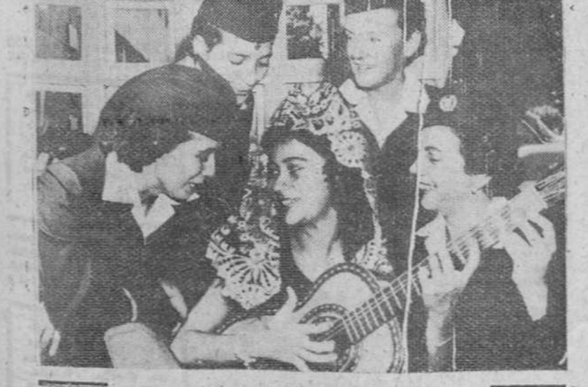
Vancouver (Canadá).—En los ratos que les dejan libres sus estudios de azafatas—para servir en líneas aéreas a España y países iberoamericanos—, estas cinco jóvenes españolas cantan y bailan sonnes de nuestra tierra al compás de la guitarra.