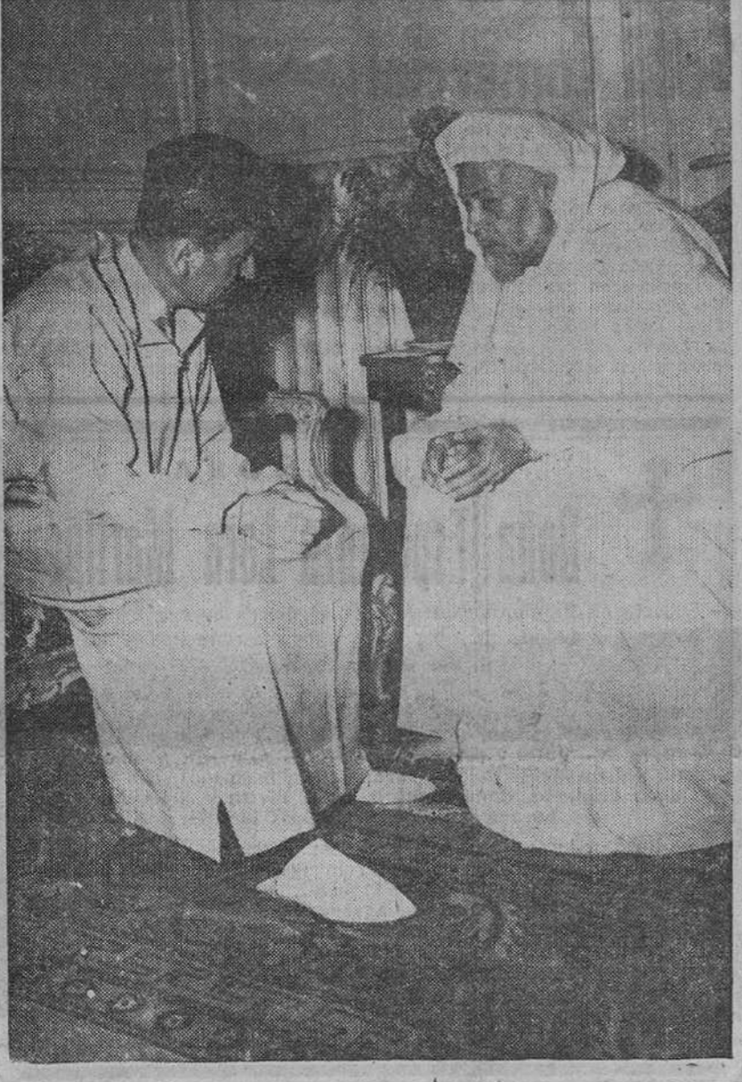
Paris. — El Sultán Ben Yusef conversa con el Caid Lalyedi de Rhanna durante las audiencias que en estos días viene concediendo en el castillo de la Celle Saint Cloud. — (Foto Cifra)