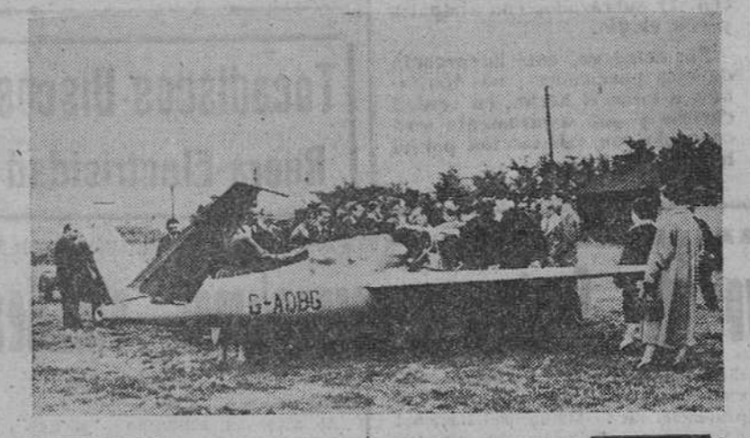
Londres. — Después de un vuelo de pruebas sobre Woodley, los visitantes se agolpan en torno al nuevo avión ligero a reacción británico "Ski" en el que la reducida área de sus alas, su calidad de ataque y potencia en relación con su escaso peso, hacen de él el biplaza reactor más económico del Mundo. Sus asientos están dispuestos en tandem, el delantero para el piloto. En el posterior lleva un duplicado de los mandos, para el aprendizaje elemental del vuelo a reacción.