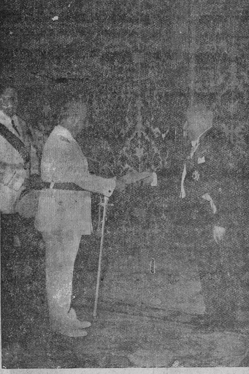
Madrid. — El nuevo embajador del Líbano en España, Sami El-Khoury, en el momento de presentar sus cartas credenciales a Su Excelencia el Jefe del Estado, Generalísimo Franco, en el Palacio del Perdo.