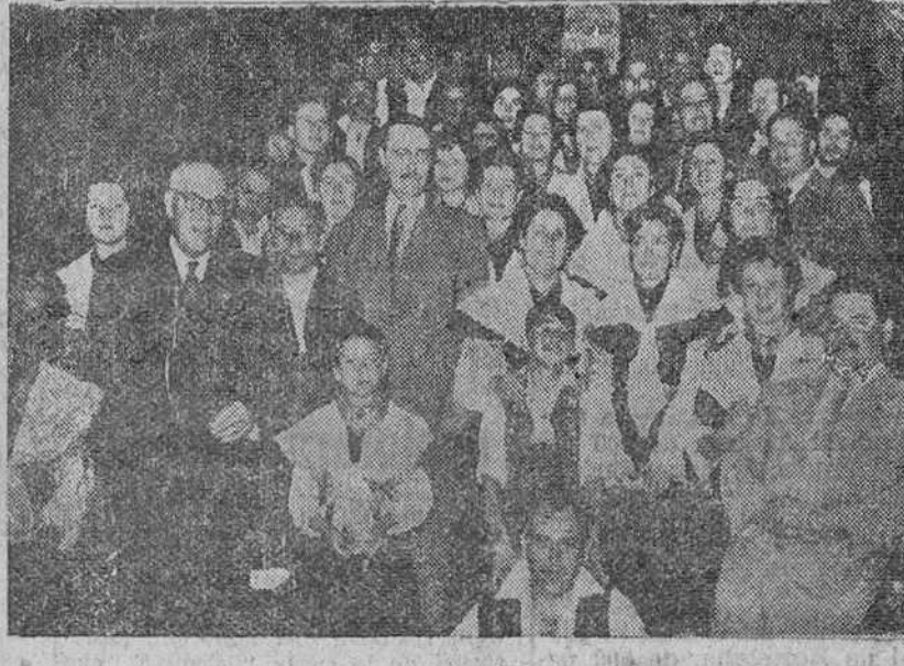
He aquí al coro corués "Cantigas da Terra", rodeando al alcalde después de su visita a la Casa Consistorial.