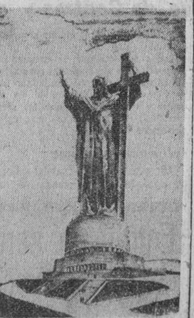
He aquí la magnífica imagen de Jesús que será erigida en la zona de una colina en Rocca di Papa, a tres kilómetros de Roma, en el mismo sitio que ocupó el templo de Júpiter.