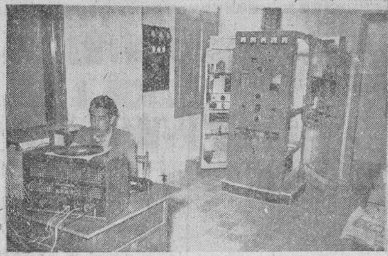
He aquí dos placas fotográficas recogiendo otros tantos planos de la emisora-escuela inaugurada en Aranda de Duero por el Frente de Juventudes. — Arriba, edificio en que se halla enclavada; abajo, un detalle de sus instalaciones.