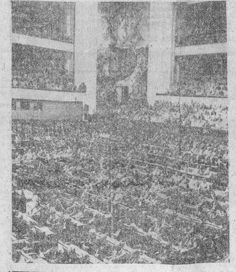
Ginebra. — Una vista general del Palacio de las Naciones durante la apertura de la Conferencia "Atomos para la paz".