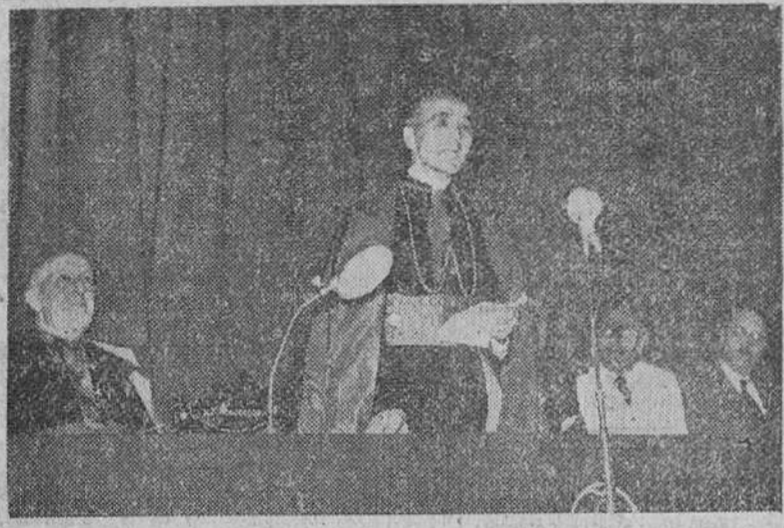
Monsieur Antoniutti, Nuncio Apostólico en España, durante su brillante intervención en la VIII Semana de Orientación Misional.

Las jornadas de la gran Semana Misional, de día en día van adquiriendo mayor brillo y esplendor. El entusiasmo y fervor no sólo no decaen en momento, sino que cada día se renueva y aumenta sin que la fatiga y el cansancio haga mella en los seminaristas. Todavía ayer por la mañana menudeaban los comentarios en torno a la magnífica conferencia del reverendísimo Padre Dezza, que tanto interés despertó entre los innumerables asistentes de todas las condiciones sociales que llenaban materialmente el salón. Las películas proyectadas en la sesión privada de los seminaristas, han calmado las ansias del más exigente en la materia, haciéndose todos elogios de los diversos films proyectados. Los asistentes a las conferencias misionales de finadas al público, han ido aumentando de día en día considerablemente. La película en color sobre la Misión de Rhedasia ha gustado extraordinariamente.