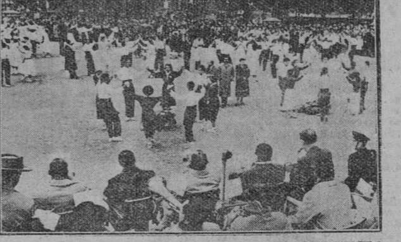
Barcelona. — El día del aniversario de la liberación de Barcelona se ha celebrado con muy diversos actos, no faltando entre ellos las sardanas, que se bailaron a pesar del mal tiempo, con asistencia de gran cantidad de público en la central plaza de Cataluña.