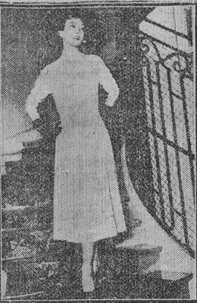
con esta invasión tropical, que tanto divierte a los parisienses.