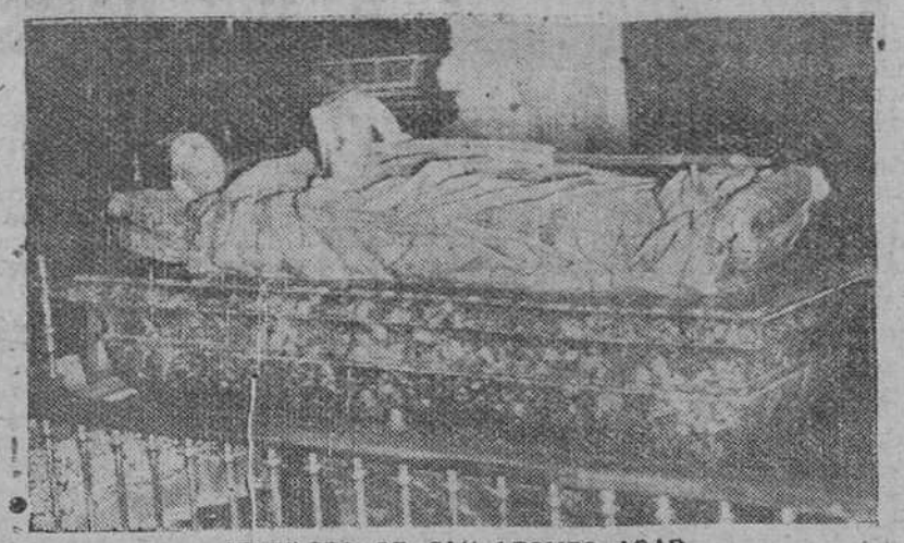
SEPOLCRO DE SAN LESMES ABAO