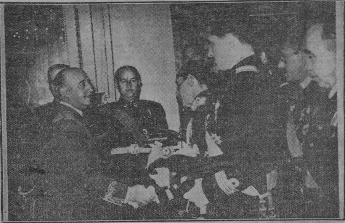
Madrid. — Nutridas representaciones de todas las Armas y Cuernos del Ejército, presididas por los ministros del Ejército, Marina, Aire, Gobernación, secretario general del Movimiento, Industria y subsecretario de la Presidencia, acudieron al palacio de El Pardo para saludar a S. E. el Jefe del Estado, con motivo de la Pascua Militar.