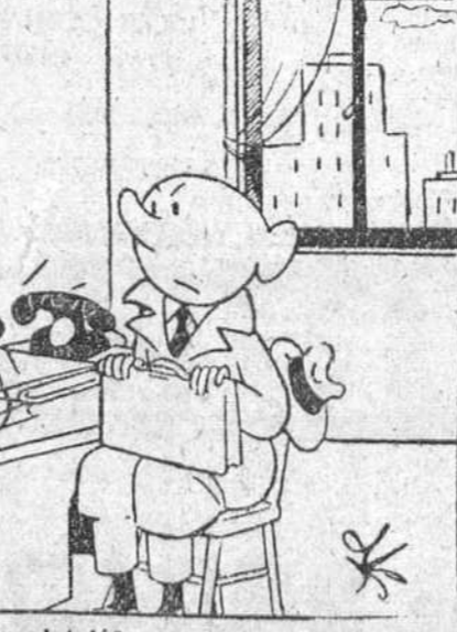
—Por favor, quiere atender al teléfono mientras despacho con mi secretario? Sólo tiene que decir a todo que sí. Es mi mujer.

DENTRO de un año y pico — el 3 de Noviembre de 1956 — habrá un siglo que nació en Santander don Marcelino Mendez Pelayo.