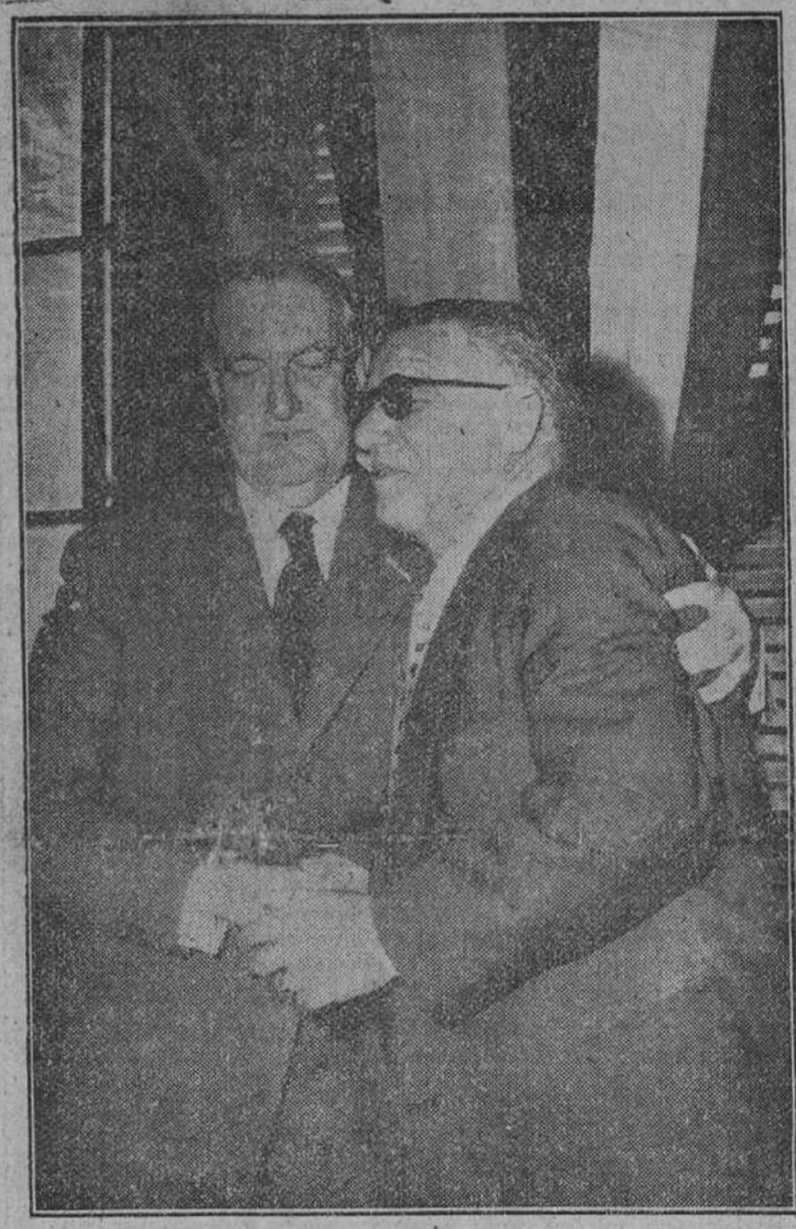
La Habana.— Un momento de la visita del ministro de Obras Públicas español, conde de Vallellano, a los Centros Gallego y Asturiano, en donde fué recibido por las respectivas juntas directivas. Se pronunciaron discursos y el ministro español hizo resaltar la españolísima labor que están realizando en Cuba dichos Centros.