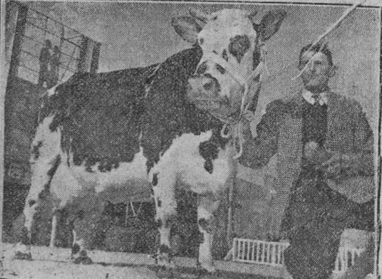
Pesa 752 kilos, tiene ocho años y ha producido en 59 meses, 42.500 litros de leche con un 4% de materia grasa. En el concurso general ganadero de Francia ha obtenido el primer premio. Su propietario la exhibe orgullosamente.