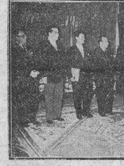
Madrid. — Un momento de la audiencia concedida por S. E. el Jefe del Estado a la directiva de Informadores gráficos...