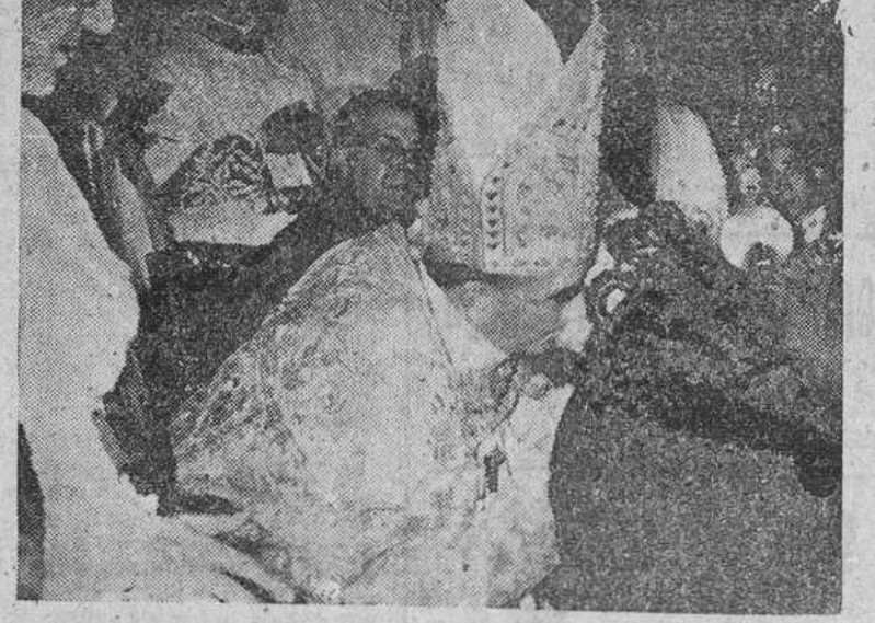
Zaragoza. — Emocionante momento en que el nuevo Arzobispo de Zaragoza, Dr. Morcillo, abraza a su madre durante el acto del besamanos a las autoridades y personalidades de la capital. — (Foto Cifra)