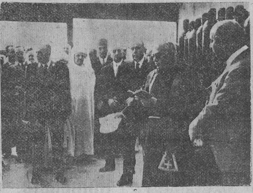
Tetuán. — Un momento del acto de bendición de los nuevos locales de la fábrica de "Oxígeno Marroquí, S. A.", inaugurada por las autoridades españolas y marroquíes.

Inauguración de una industria en el Protectorado español en Marruecos