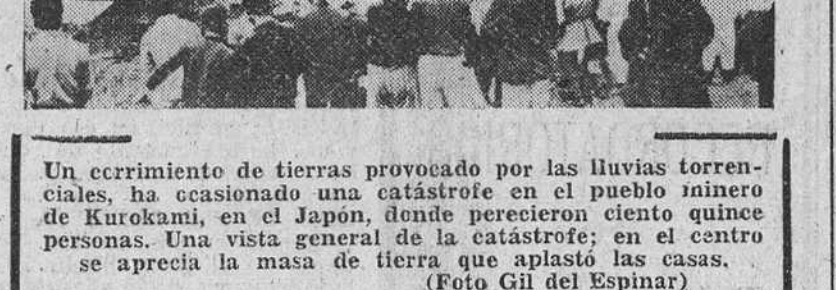
Un erramiento de tierras provocado por las lluvias torrenciales, ha ocasionado una catástrofe en el pueblo minero de Kurokami, en el Japón, donde perecieron ciento quince personas. Una vista general de la catástrofe; en el centro se aprecia la masa de tierra que aplastó las casas.