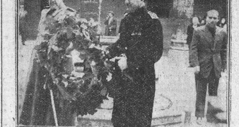
El gobernador civil y jefe provincial del Movimiento y el general Lossada, en el momento de depositar una corona de laurel ante el busto de José Antonio, en el patio de la Casa del Cordón, con motivo de los actos celebrados ayer en nuestra ciudad, en conmemoración del "Día de la Unificación".