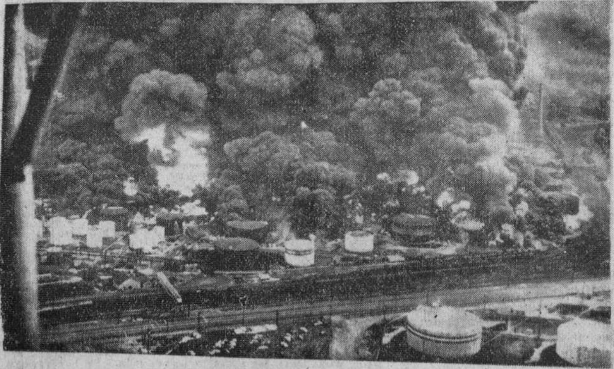
Whiting (Indiana, Estados Unidos).— Un aspecto del pavoroso incendio declarado en la refinera de petróleos de la Standard Oil. Más de un millar de personas se afanan en evitar se extiendan las llamas.