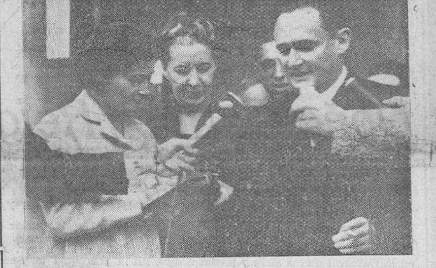
París. — Mr. Bourges-Maunoury, ministro de Defensa Nacional, que ha logrado formar Gobierno, es interrogado por los periodistas a la salida del Eliseo.

Ganó la votación por 242 votos contra 161