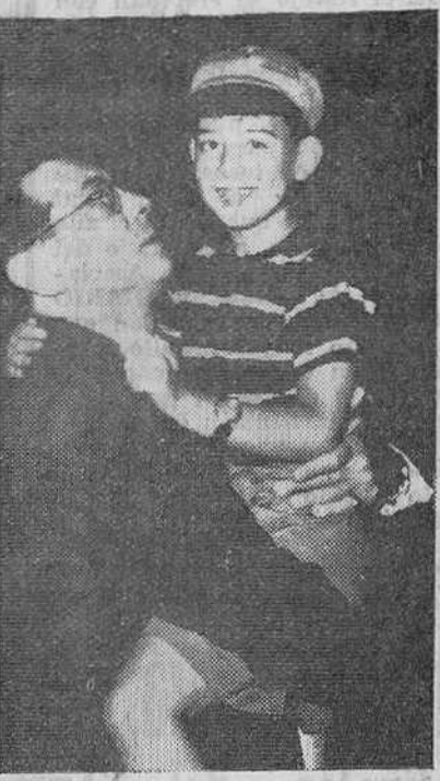
Venecia.— Pablito Calvo, el joven actor cinematográfico español, con el director Ladislao Vajda, a su llegada a Venecia para asistir al Festival del Cine.— (Foto Cifra)

Pablito Calvo atracción del Festival de Cine en Venecia