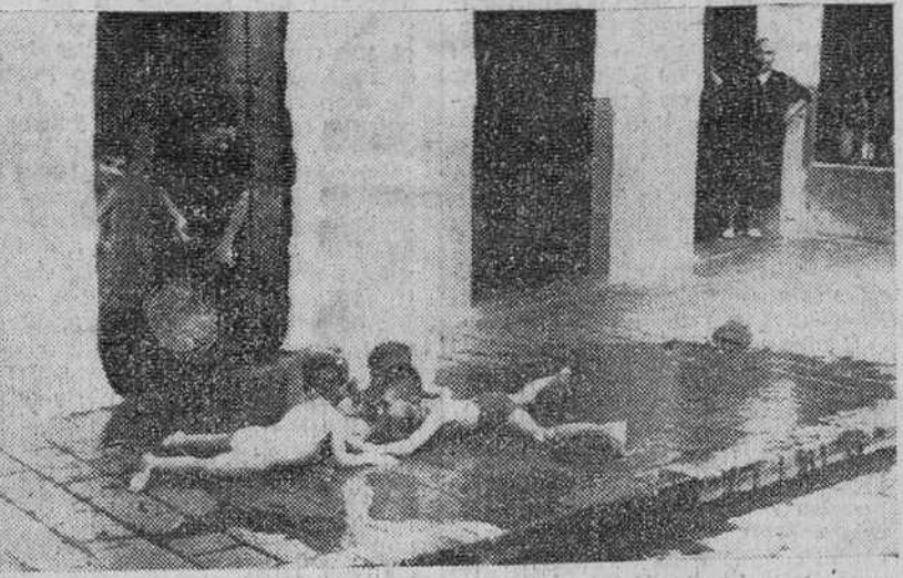
Beja. — He aquí uno de los muchos recursos que algunas familias humildes ecijanas adoptan ante las temperaturas de 45 y 46 grados a la sombra, que se registran en esta región de Andalucía. Unos cubos de agua sobre la acera asfaltada y la imaginación de los pequeños beneficiarios de la mojadura, hace todo lo demás.