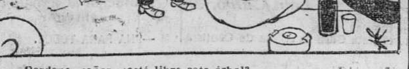
—Perdone, señor, ¿está libre este árbol?