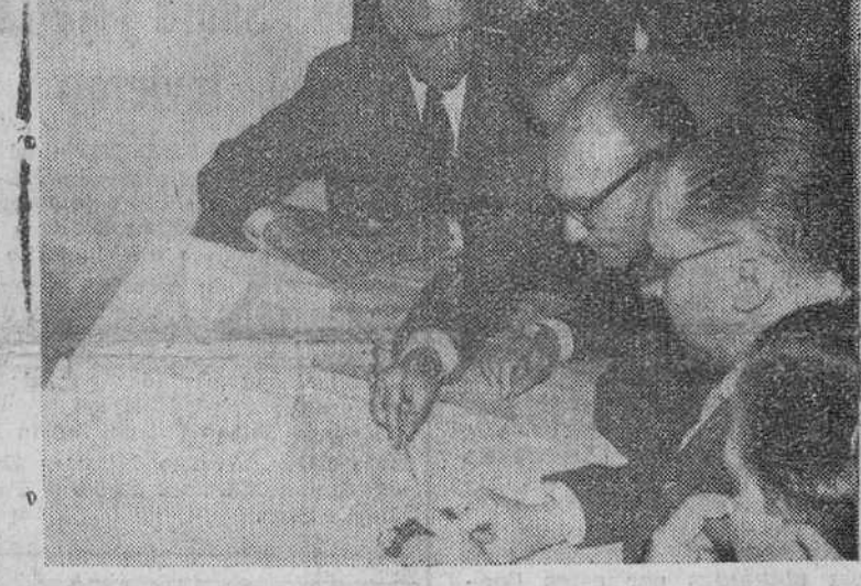
Tres documentos gráficos de la visita realizada ayer por el excelentísimo señor ministro de Obras Públicas a las obras del túnel de "La Engaña". De arriba a abajo, el señor Vigón, a la salida del túnel, dirigiéndose hacia el poblado obrero; el ministro pronunciando unas palabras en el almuerzo íntimo celebrado en el poblado y por último, examinando los planos de las obras.

Prometió el ministro apoyar la petición de ambas provincias para que el Estado saque a subasta el tramo final de infraestructura del ferrocarril Santander-Mediterráneo