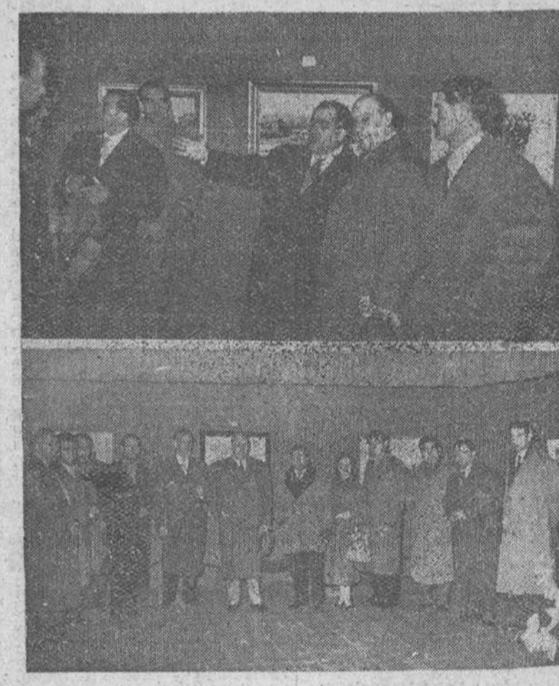
Con asistencia de autoridades y personalidades, se inauguró el lunes en Burgos la Exposición de Arte organizada a beneficio de la "Campaña de Invierno" y en cuyo certamen figuran expuestas las más diversas obras con que los artistas burgaleses o afluídos en nuestra ciudad, han querido sumarse entusiastamente a la ejemplar obra de caridad que impulsa y patrocina el gobernador civil de la provincia. Acercos de la apertura de dicha exposición ofrecemos las presentes placas en las que puede verse, arriba, al señor alcalde comentando las características de uno de los cuadros, junto a la primera autoridad civil y otras personalidades. En la parte inferior posan varios de los artistas participantes junto al señor Fernández-Victorio.