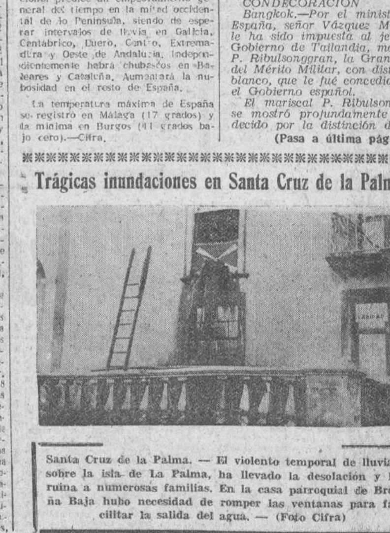
Santa Cruz de la Palma. — El violento temporal de lluvias sobre la isla de La Palma, ha llevado a la desolación y a la ruina a numerosas familias. En la casa parroquial de Breña Baja hubo necesidad de romper las ventanas para facilitar la salida del agua.