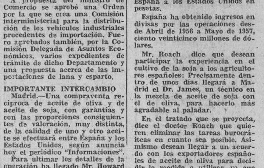
Madrid.—Una compraventa reciproca de aceite de oliva y de aceite de soja, con garantías y con las proporciones consiguientes de valoración, muy distinta, de la calidad de uno y otro aceite se efectuará entre España y los Estados Unidos, según anuncia hoy el periódico "Informaciones".