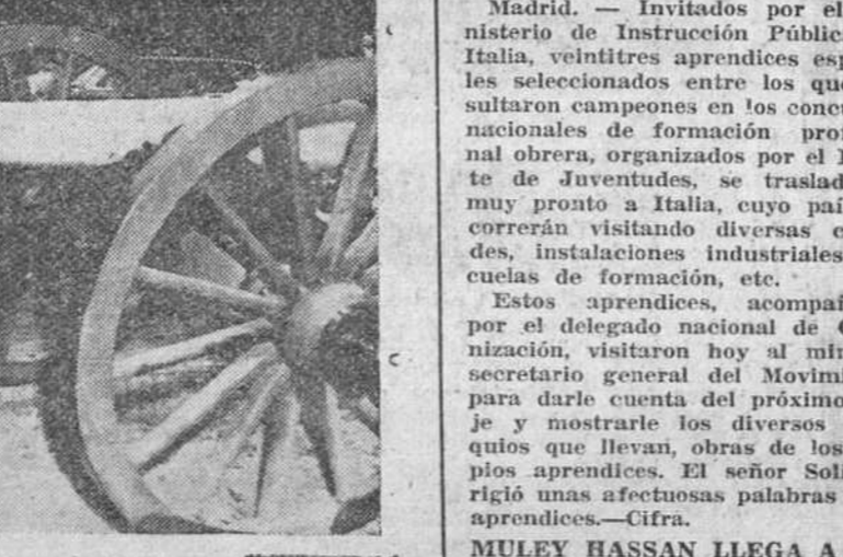
Gettysburg.—El presidente Eisenhower y el mariscal Montgomery inspeccionan un viejo cañón americano de la guerra civil, durante la visita de ambas personalidades al campo de batalla histórico de esta localidad. Los dos militares realizaron, suponemos que por puro pasatiempo, un detenido estudio de la famosa batalla de la guerra civil y llegaron a la conclusión de que ellos la hubieran desarrollado de manera diferente.