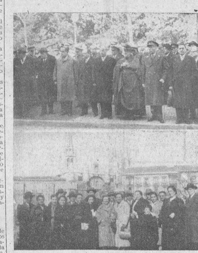
Los Cuerpos general de Policía, Policía Armada y de Tráfico celebraron ayer la festividad de su Patrono, el Santo Angel de la Guarda, de cuya fiesta ofrecemos las presentes placas tomadas por "Fede" después de la solemne misa que tuvo lugar en la iglesia de la Merced. En el grabado superior aparecen el arzobispo de la diócesis y demás primeras autoridades, presenciando el desfile de las fuerzas. En la fotografía inferior un grupo de concurrentes a la ciudad ceremonia.