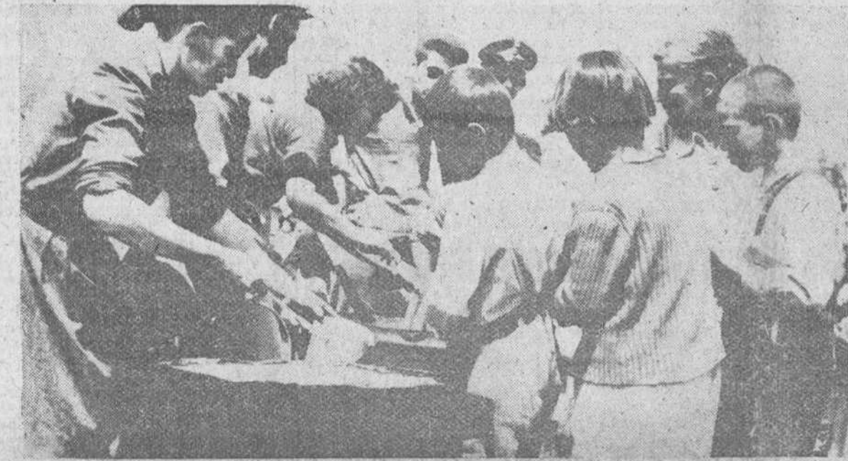
Volos. — En la zona de Parsala, una de las más afectadas por los actuales terremotos, el mayor desastre ocurrido en Grecia desde 1954. Se procede a la distribución de comida caliente entre aquellos que quedaron sin hogar.