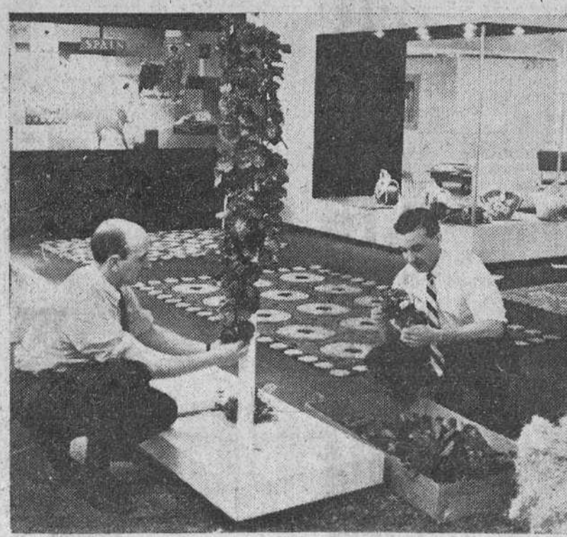
Nueva York.— Preparativos para la instalación del pabellón español en dicha Feria.— (Foto Cifra)