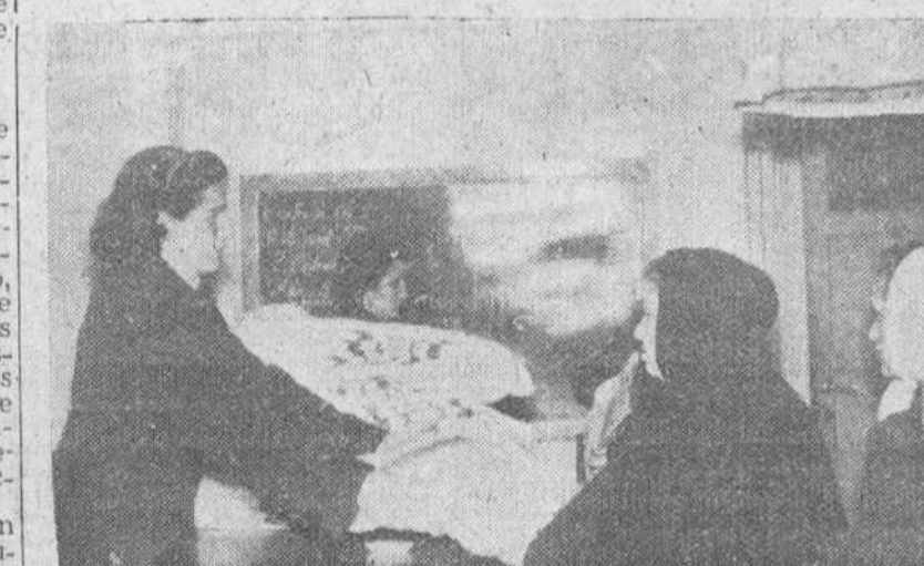
En la Escuela Hogar de la Sección Femenina se ha celebrado el acto de entrega de mantas de la Campaña de Invierno donadas por el Excmo. Gobernador civil, con destino a familias atendidas en Divulgación. Asistieron la delegada provincial en funciones, secretaria provincial en funciones y regidora local de Divulgación.