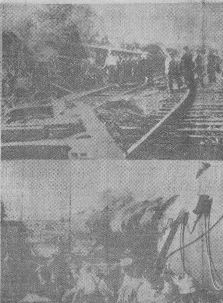
Nozieres-Brignon. — Dos vistas del lugar donde sucedió el descarrilamiento durante los trabajos de rescate de las víctimas. Hubo que lamentar 26 muertos y cerca de 50 heridos. La causa fue debida al exceso de velocidad del expreso, a 90 por hora, cuando por aquel lugar debía pasar a 30 como máximo.