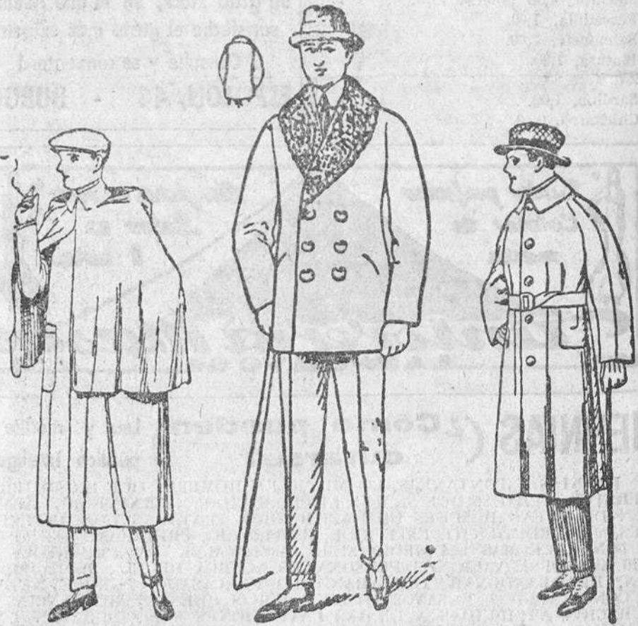
Impermeables esclavina desde 90 a 150 pesetas Pellizas cuello rizo en pelo castor desde 20 a 125 pesetas Trincheras desde 25 a 100 pesetas 1.000 pellizas, desde 20 a 125 pesetas - 2.000 trincheras, desde 25 a 100 pesetas

Siempre grandes existencias encontrarán en la Casa Munguía Plaza Mayor, 42, y Lain-Calvo, 9 y 11.-Burgos