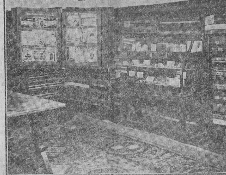
Una vista de la sala de Burgos en el pabellón de Castilla y León