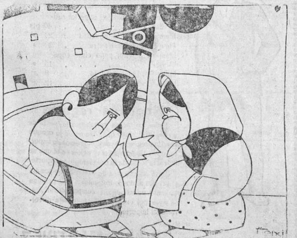
—Yo no sé dónde han tenido los ojos para elegir a esa que va a ir a los torcos de Burgos.

La casa editorial Hijos de Santiago Rodríguez, que todos los años por esta época publica un catálogo de las obras, que referentes a Burgos o escritas por autores burgaleses se han impreso, ha hecho este año una nueva edición muy completa, con fotografías de la capital y de la provincia y varios datos e indicaciones muy útiles al turista.