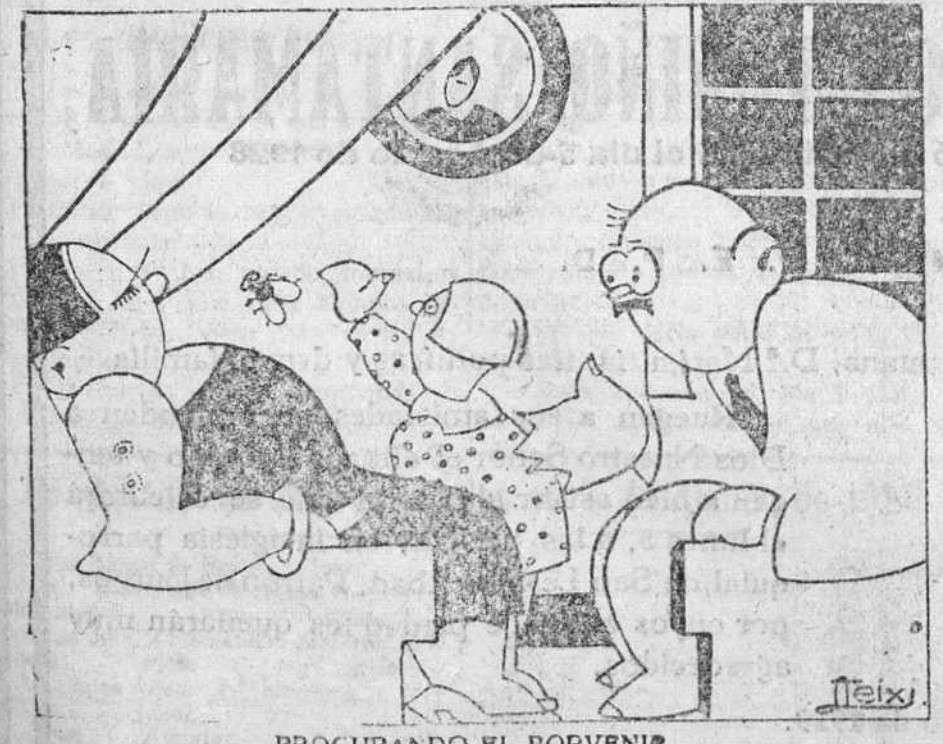
PROCURANDO EL PORVENIR

EN LAS CABEZAS DE PARTIDO y pueblos importantes de la provincia,