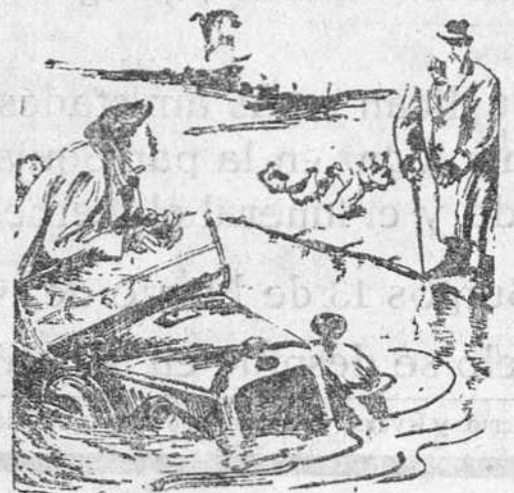
¿No sabe usted, señor, que esta laguna es exclusivamente para los patos?